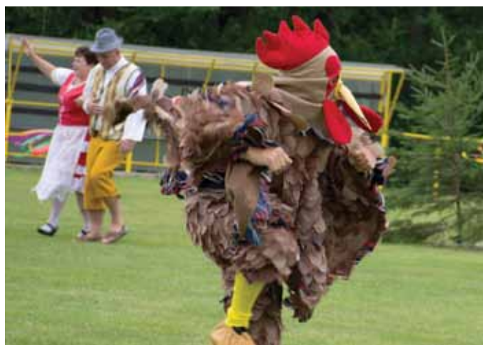
Staročeské stínání kohouta, Načešice

2. prosince Rozsvícení vánočního stromu, jarmark a vánoční koncert I Seč Mikulášská nadílka a rozsvícení vánočního stromu I Žďárec u Seče 3. prosince Slavnostní rozsvícení vánočního stromu I Třemošnice Rozsvícení Betlému na návsi I Klešice Rozsvícení vánočního stromu I Heřmanův Městec Adventní koncert na zámku I Nasavrky 10. prosince Adventní koncert na zámku I Nasavrky 17. prosince Adventní koncert na zámku I Nasavrky 23. prosince Betlémské světlo u betléma I Nasavrky 24. prosince Štědrovečerní troubení z kostela sv. Bartoloměje I Heřmanův Městec 26. prosince Expedice Krkaňka – vánoční přechod Železných hor 29. prosince Silvestr nanečisto I Seč 31. prosince Silvestrovská plavba I Třemošnice