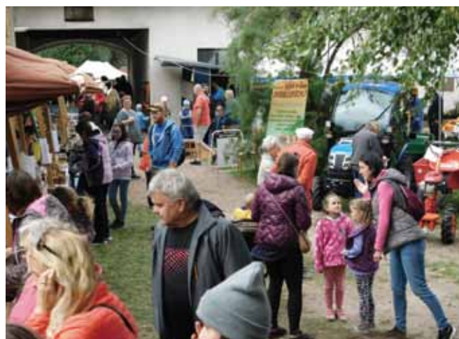
Chovatelská a zahrádkářská výstava ve Svinčanech

Specifický cíl 4.3. Podpora kulturních a volnočasových aktivit