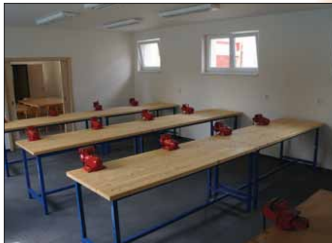
IROP: Stavební úpravy dílen – ZŠ Ronov nad Doubravou