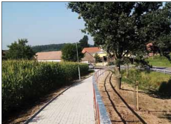
IROP: Komunikace pro chodce – Rostejn (místní část Drhotín a Zbohov)