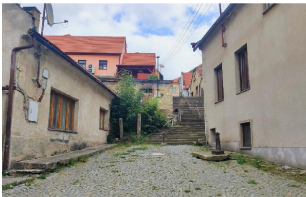
Zničená část města

Problém se vyhroutil vloni 1. prosince, kdy mi v noci zazvonil telefon s tím, že hoří dům v Luži. Dům patřil romské rodině se třemi malými dětmi. Tu noc se rodina ocitla bez střechy nad hlavou. Dočasně jsme je ubytovali v klubovně, která je určena právě pro romské občany. Ti zde tráví volný čas pod dohledem svého koordinátora. Abychom rodině poskytli důstojné zázemí, zahájili jsme stavební úpravy v městském nebytovém prostoru v jedné z našich místních částí. Udělali jsme všechno pro to, aby zde mohla rodina oslavit Vánoce. Ukázalo se, že lidé z Luže drží spolu. Nosili jim věci a oblečení. Ubytování jsme jim poskytli dočasně. Několikrát jsme ale museli prodloužit termín vystěhování, protože rodina nebyla schopna se o sebe postarat a najít si vlastní bydlení. Nabídli jsme, že bydlení